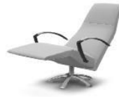
7760-MO-MI Relaxsessel mono-move mini W 68 D 82/155 H 111 SH 44 SD 50