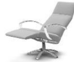
3760-MU-MI Relaxsessel multi-move mini W 67 D 82/154 H 116 SH 45 SD 48